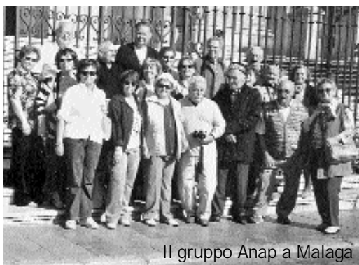
Il gruppo Anap a Malaga