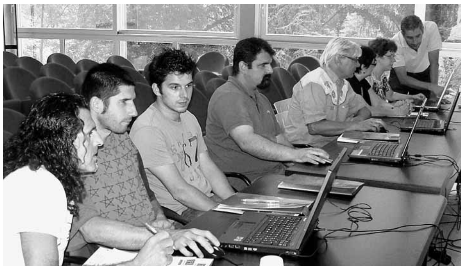
Il corso di Open Office per i lavoratori destinatari della Dote Lavoro Ammortizzatori Sociali.

Confartigianato Imprese Lecco, tramite il proprio ente di formazione accreditato ELFI, ha attivato un'offerta formativa ad hoc per i lavoratori destinatari della Dote Lavoro Ammortizzatori Sociali. In particolare, il 13 e 14 luglio si è svolto nella sede di via Galilei a Lecco il corso "Utilizzo di Open Office", con