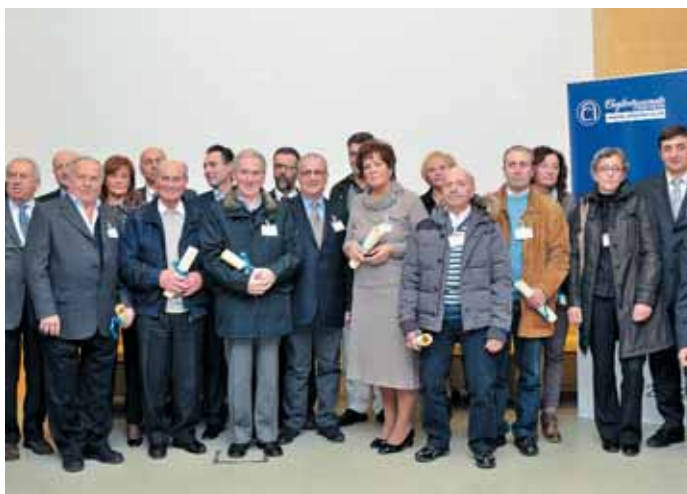
Nella foto i premiati dell'anno scorso.

Art. 4 • Le domande di partecipazione dovranno essere redatte sull'apposito modulo predisposto dall'Associazione, a disposizione negli uffici della Sede, in tutte le delegazioni e sul sito internet www.artigiani.lecco.it .