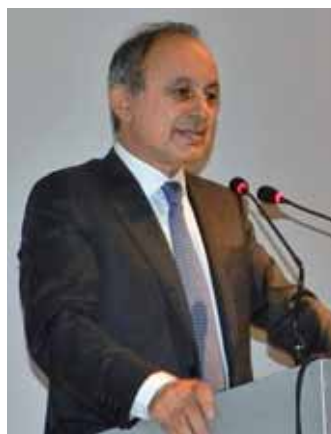
Il segretario nazionale di Confartigianato Cesare Fumagalli inaugura la 41 a Mostra dell'Artigianato.

In questa cornice sarà organizzata la tavola della convivialità, uno spazio interattivo della Mostra dove il pubblico potrà sperimentare i prodotti dell'artigianato alimentare.