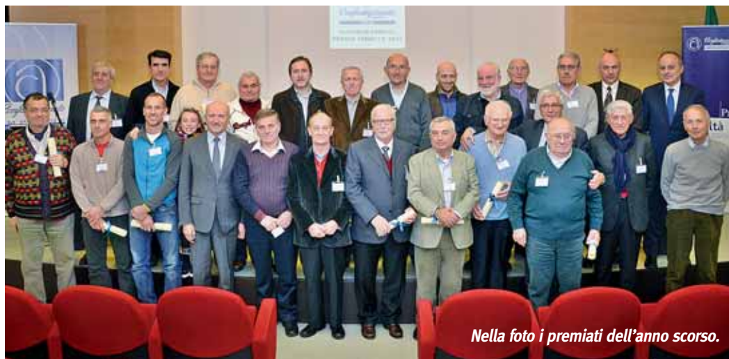
Nella foto i premiati dell'anno scorso.

► Le domande di partecipazione dovranno essere redatte sull'apposito modulo predisposto dall'Associazione, a disposizione negli uffici della Sede, in tutte le de-