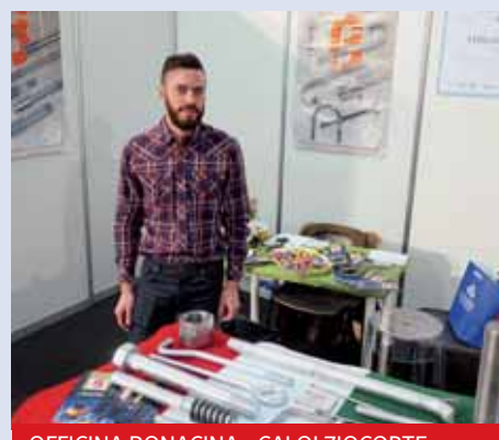
OFFICINA BONACINA - CALOLZIOCORTE