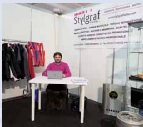
STYLGRAF - VALMADRERA