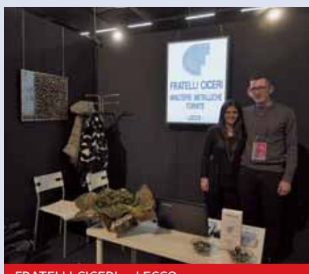
FRATELLI CICERI - LECCO