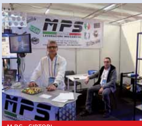
M.P.S. - SIRTORI