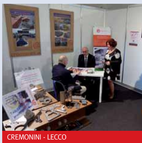
CREMONINI - LECCO