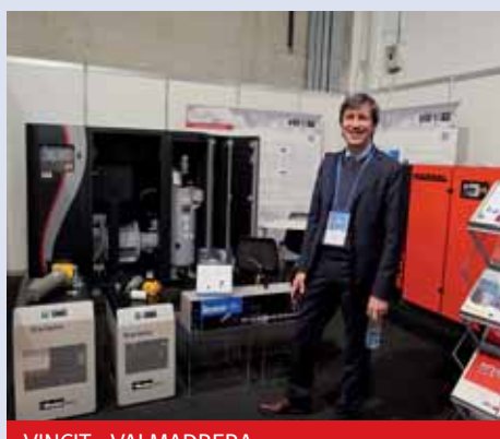
VINCIT - VALMADRERA