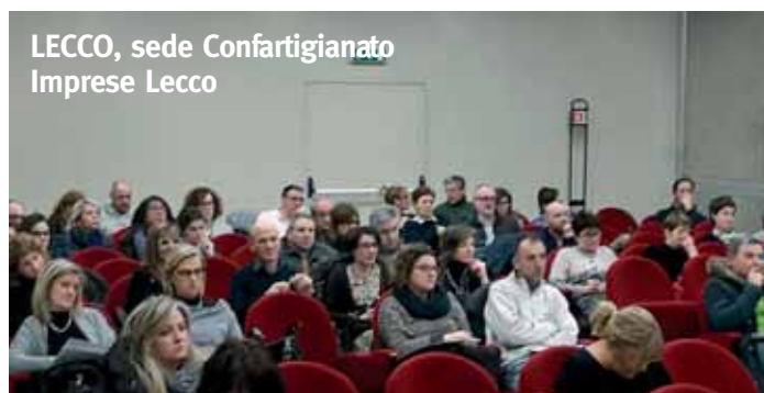
LECCO, sede Confartigianato Imprese Lecco