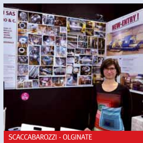
SCACCAROZZI - OLGINATE