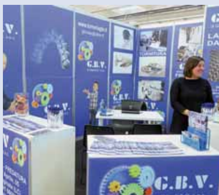
G.B.V. DI GILARDI - OLGINATE