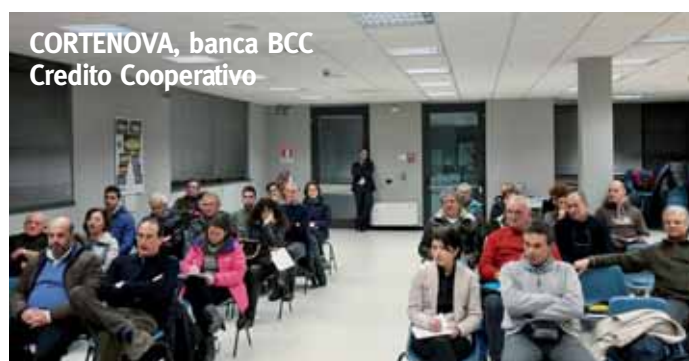
CORTENOVA, banca BCC Credito Cooperativo

Con l'entrata in vigore della "Manovra Fiscale 2017", la nostra Associazione, come di consueto, ha organizzato nel corso del mese di febbraio tre incontri a partecipazione libera per presentare le novità più importanti per cittadini e imprenditori. Anche quest'anno l'affluenza degli imprenditori è stata conside-