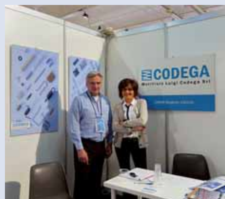
MOLLIFICIO LUIGI CODEGA - MALGRATE