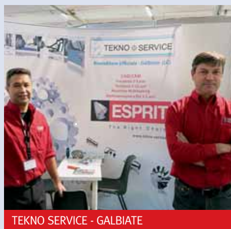
TEKNO SERVICE - GALBIATE