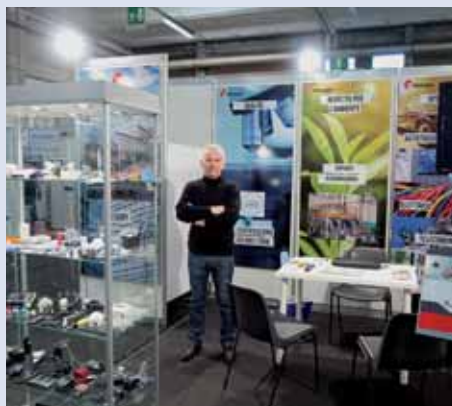
PROVER - MERATE