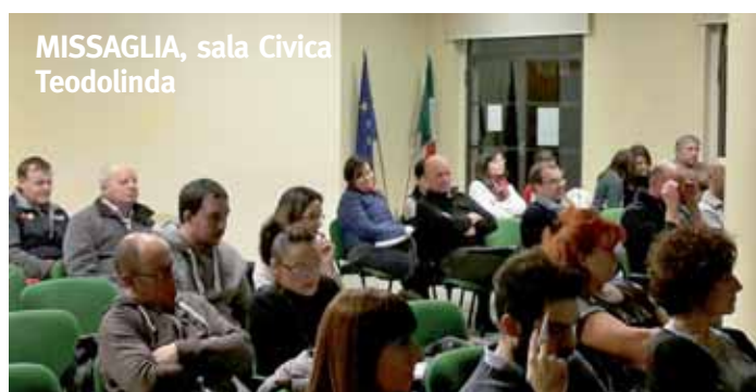
MISSAGLIA, sala Civica Teodolinda