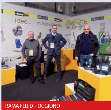
RAMA FLUID - OGGIONO