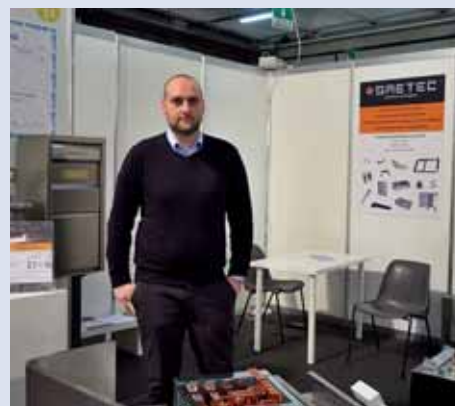
SAETEC - ROBBIATE