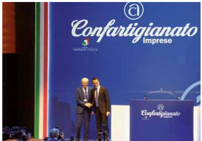
Due mila delegati hanno preso parte all'Assemblea nazionale. Sopra la delegazione leccese; sotto alcuni esponenti politici presenti.